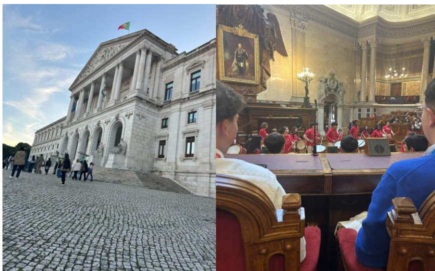
Assembleia da República