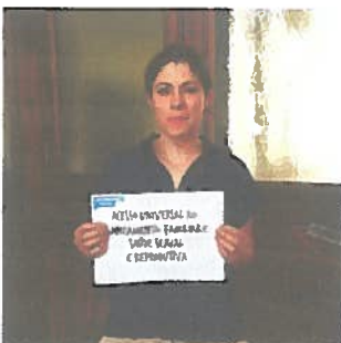
Mariana Mortágua, BE