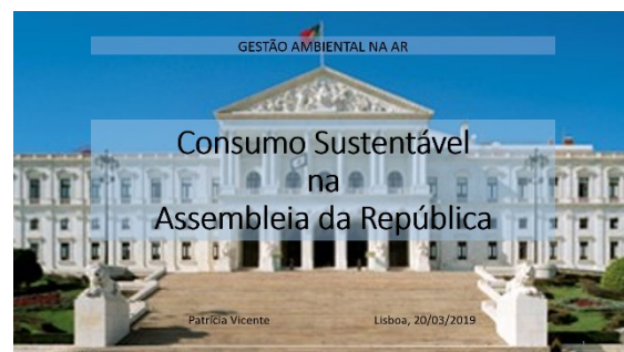
Capa da apresentação sobre o “Consumo Sustentável na Assembleia da República”

12h – Encerramento da Sessão ( Pedro Soares, Presidente da Comissão de Ambiente, Ordenamento do Território, Descentralização, Poder Local e Habitação )