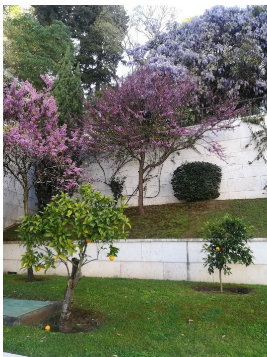
Jardim da ROPAR