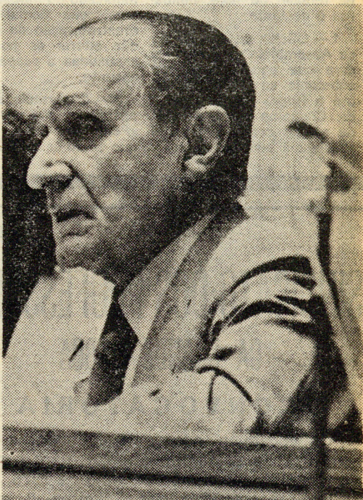
VASCO DA GAMA FERNANDES: presidente da Assembleia da República